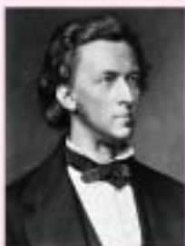
フレデリック・ショパン Frédéric Chopin (1810-1849)