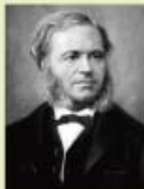
セザール・フランク César Franck (1822-1890)